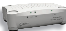
Corinex AV200 CableLAN adapter

Corinex har också produkter för att bygga nätverk över TV-kabel för fastighetsnätverk. Corinex AV200 CableLAN adapter, gör det möjligt att få upp till 200 Mbps hastighet över TV-kabeln på 300 meters avstånd. Mer info på www.aracta.com .