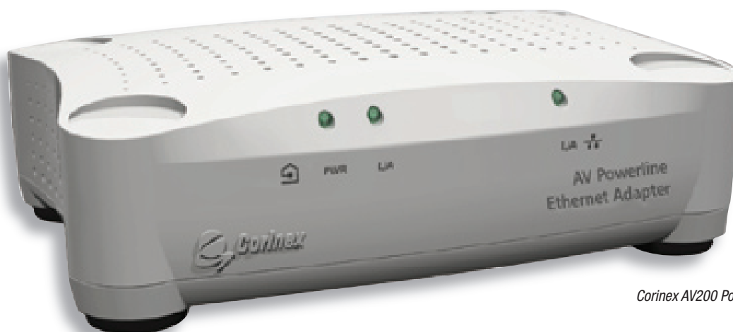
Corinex AV200 Powerline adapter

Skapa nätverk via elnätet på några minuter